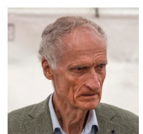
# 5 Bertel Haarder