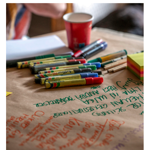
De vackra somrardagarna inbjöd till att samtalen fortsatte även utanför de mer planerade gruppdiskussionerna.

Att stärka banden från botten är dessutom en form för säkerhetspolitik. Några